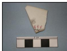
Figura 7: Louça moderna