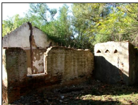
Figura 1: casa/sede.

Após o testemunho oral do proprietário, fez-se um reconhecimento do terreno, que se denomina prospecção ou survey . Inicialmente foram identificadas duas estruturas no sítio arqueológico, a casa/sede da estância (Figura 1) e uma estrutura ao lado, que segundo o proprietário seria um galpão.