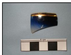
Figura 5: Ironstone