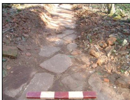
Figura 3: Piso do galpão.

A estrutura denominada de “galpão” encontra-se com as paredes colapsadas. Dessa forma, a atividade proposta inicialmente foi de evidenciamento das paredes caídas, e do piso dessa estrutura. Na parte externa da frente foi aberta uma sondagem de 1m x 1,50m x 0,40 m (sondagem 1), e, a partir, desta uma trincheira de 0,50m x 4m x 0,50 m de profundidade. Na parte interna da estrutura foi removida uma camada de 0,15 m de terra e materiais construtivos até que se evidenciasse o piso (Figura 3).