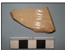
Figura 6: Grés