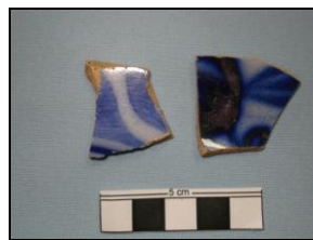
Figura 11: Borrão Azul