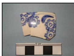
Figura 4: Faiança fina