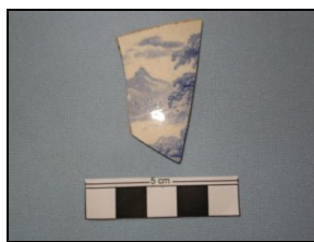
Figura 10: Transfer Printed

Além de fragmentos pintados a mão livre e a mão com impressão, apareceram fragmentos decorados com pintura mecânica, conhecidos como transfer printing (Figura 10), um processo mecânico de impressão por transferência, que permite a repetição do desenho em várias peças. Outro tipo de decoração encontrado foi o borrão, tipo de técnica em que são adicionados produtos químicos durante a queima (Figura 11).