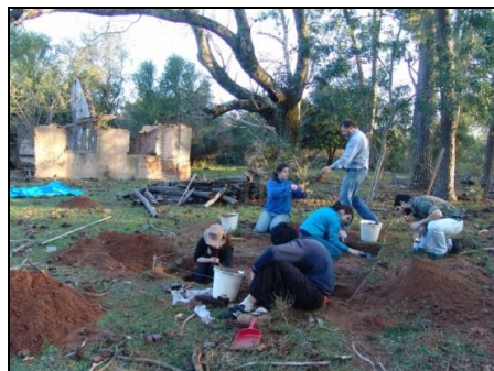
Figura 2: Sondagem controlada 1.

descarte. Nas sedes de estância e chácaras do século XIX era comum o descarte aleatório de lixo, mas também faziam buracos para o descarte de lixo doméstico (TOCCHETO, 2004, p. 257).