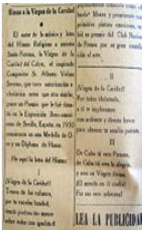
Himno a la Caridad del Cobre a través de la prensa de la época

De Cuba tu eres Patrona, De Cuba tu eres la alegría, Y eres su Virgen divina! ¡El mundo en ti confía! Por eso eres soberana