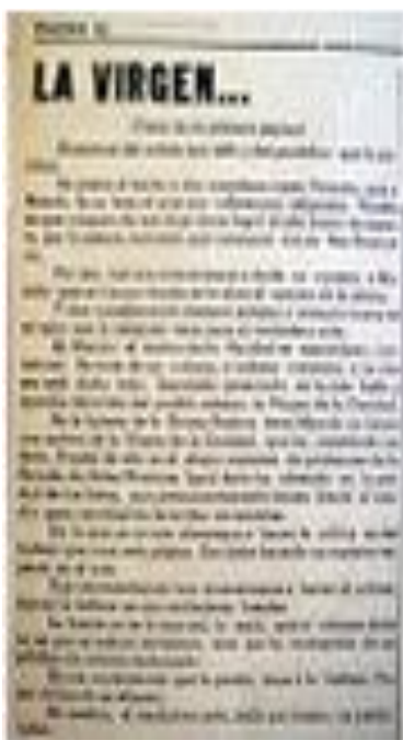
Divulgación de la obra del artista plástico