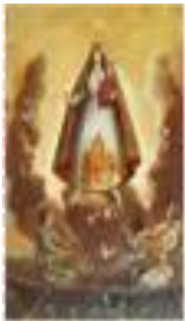
Pintura al óleo sobre lienzo de la Virgen de la Caridad que data de 1866